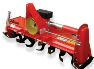
Fraise arrière 105 cm