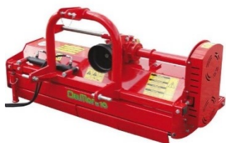
Broyeur à fléaux 106 cm