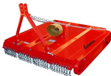
Gyrobroyeur 100 cm