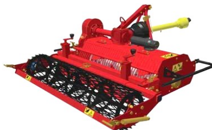
Enfouisseur de pierre 90 cm