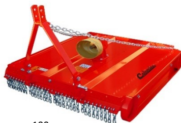
Gyrobroyeur 100 cm